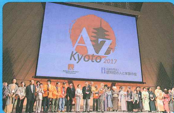
国際会議には国内外から4000人が参加

また、国際会議の準備から発表において、国内で初めて認知症関係当事者5団体（「家族の会」含む）が協働して取り組むなど、大きな成果がありました。一方で、認知症になっても安心して暮らせる社会になるには、下記のような課題も残っています。