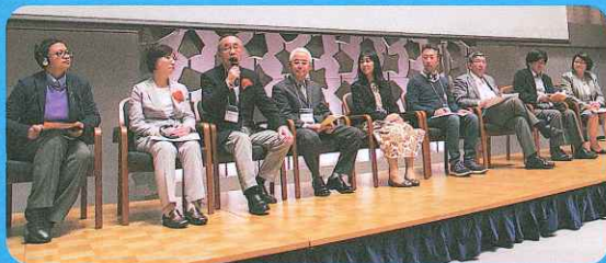
認知症関係当事者5団体の発表