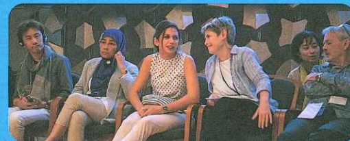
ワークショップの様子