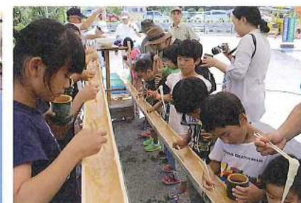
流しそうめんde夏祭り