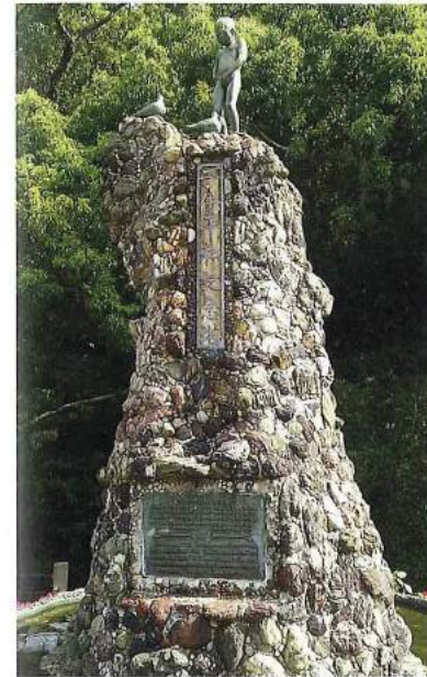
子供平和記念塔（徳島中央公園） 「すべてのお友達を幸福にしましょう」という精神のもと、県内17万人の子ども民生委員が国内や海外から小石を集め、1948年に完成しました。