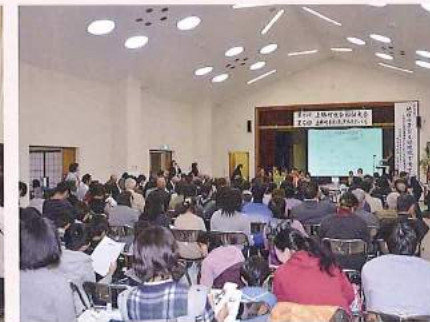
福祉大会・ボランティアフェスティバル