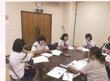
ボランティアスクール打ち合わせ