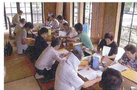
策定委員会の様子

美馬市社会福祉協議会と第2次地域福祉活動計画策定委員会は、「10年後、自分たちが住み続けたいと思える美馬市を自分たちで創ってみませんか」をスローガンに、住民主体による地域コミュニティの再構築に向け、美馬・脇町・穴吹・木屋平の各地区において孤立防止や防災訓練の実施など、様々な地域の課題解決に向けたまちづくり活動を計画し、各地区の実行委員会が実践しています。 実行委員会を中心とした取り組みを進める中、5年前の計画策定当初には見られなかった社会情勢の急激な変化や関連する福祉制度の改正等、私たちの生活も少なからず変わってきました。そこで新たな計画を策定する必要性が高まったこともあり、平成30年度からの第3次地域福祉活動計画の策定に向け、策定委員会を開催しています。2か月毎の開催により、各地区での現在、また今後のニーズや課題を策定委員と共に話し合っています。 美馬市内の社会福祉法人や介護サービス等の利用者の声や、地域に出向き、地域住民の声を聴きながら、地域のあらゆる住民が役割を持ち、支え合いながら自分らしく活躍できる「我が事丸ごと」の地域づくりを目指し、地域がひとつになれるような計画づくりを進めています。第3次の計画づくりのテーマは「ちょボラで地域づくり」としています。お互いに安心して暮らすことのできるよう、ちょっとしたお手伝いのボランティア。支え合いと見守りによるつながりの構築に向け、地域の方々と共に取り組んでいます。