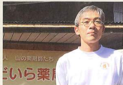
おおはやしりてき 文・大林秀樹