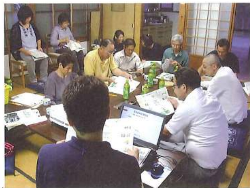
地域ふくし座談会