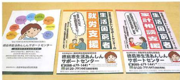
サポートセンターパンフレット

これらの支援をするなかで、地域福祉の推進を行う社会福祉協議会の本来業務は何かという問題意識が職員間で醸成されました。ひとつひとつの課題解決に向けては、地域で継続して見守る体制づくりが必要であり、毎朝、ケース会議による情報共有や支援内容の協議を行い、相談者との信頼関係の構築に努めるとともに、各関係機関・団体とのより密接な連携を心掛けた支援を進めています。