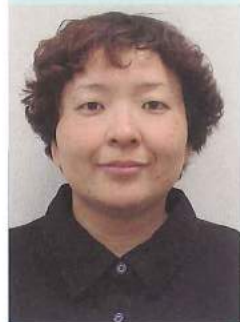
徳島県立障がい者交流プラザ 視覚障がい者支援センター