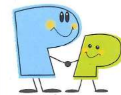
マスコットキャラクター プラザ

770-0873 徳島市東沖洲2丁目14番地 沖洲マリンターミナルビル1F tel:088-664-8211 fax:088-664-5345 e-mail:info@plaza-tokushima.com http://www.plaza-tokushima.com http://www.tokuvjc.jp