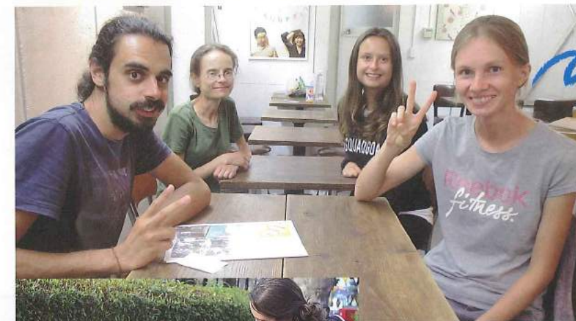
NPO法人眉山大学 外国人ボランティアのみなさん

3ヵ月間徳島に滞在し、徳島市中心部にある「とくしままちなか花ロード」の花壇の整備をされました。夏の日差しのきつい中、花の水やりや除草作業をしていると、子ども達から高齢者の方まで、たくさんの人に「おつかれさま」「ありがとう」と声をかけられてうれしかったそうです。「とくしまが好き」とおっしゃっていました。