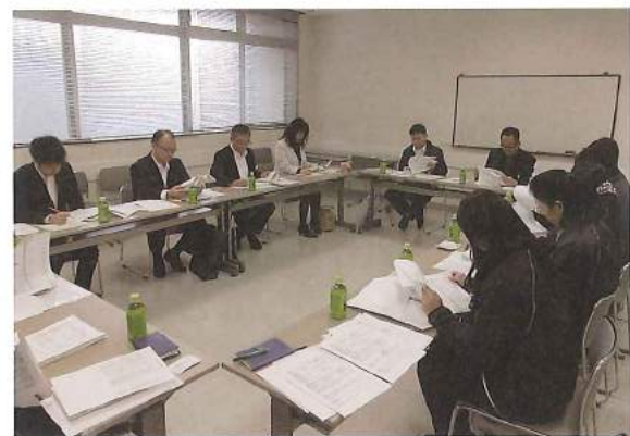
毎月開催される支援調整会議の様子

徳島市社協では、生活に困窮している世帯を支援するために「徳島市生活あんしんサポートセンター」を設置し、仕事や生活の困りごと、悩みを抱える方の相談に対応する体制を整えています。仕事に就けず生活に困っている方には、就労支援員による相談。知人等からの借り入れや家賃、ライフラインの等の滞納がある方には、家計相談支援員が家計表やキャッシュフロー表等を作成し、家計の「見える化」を図り支援を行っています。