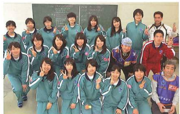
海部高校 災害ボランティア入門講座

平成26年8月に発生した豪雨災害における支援経験を踏まえ、一般社団法人災害復興支援協議会タツシユ隊大阪と「災害ボランティアセンター運営支援等に関する協定」を締結し、発災時のボランティアのコーディネートや、平常時からの研修等の協力体制を構築しました。その一環として、地元海部高校生のボランティア活動の推進のため一人暮らしの高齢者に協力いただき、ケアマネージャーが受け付けた生活上での困りごとに直接対応する災害ボランティア入門講座を企画・実施する等、地域でたすけあい、住民が元気になるネットワークづくりを進めています。