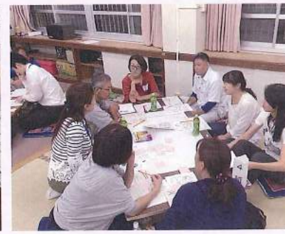
地域座談会の様子