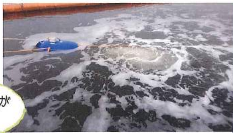
団体独自の技術のひとつ、水質浄化装置 YOU