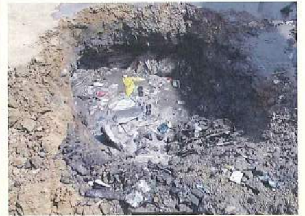
浄化する 前の汚水