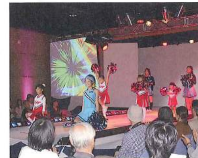
藍住インディゴコレクションに参加

ただダンスだけをやっている団体だというのではなく、まちづくりを基本に、子どもの健全育成にもつなげていながら、地域社会に広く貢献していきたいです。また、子どもたちが楽しく長く続けていきたいと思うような場所でありたいと思います。