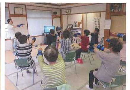
サロンでのいきいき百歳体操