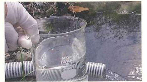
YOU による 浄化した水