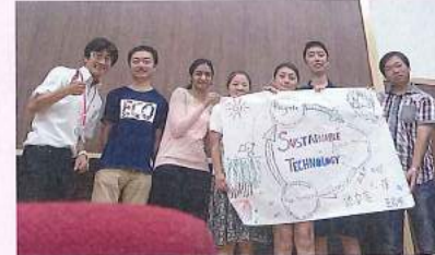
徳島大学での講演

日本人の出す汚水は、1日に平均200L/人 と言われています。学習の経験により、汚水を1 日に1Lでも減らすとどうでしょう?そんな人が家 族単位、地域の人々、街全体で、このような自然 界へのおもいやりを持つことができれば、きっ とそれは大きな力へと変わっていきます。自然に 囲まれた徳島を未来へ繋げるため、一人ひとりが 自然界との架け橋となれることを願います。