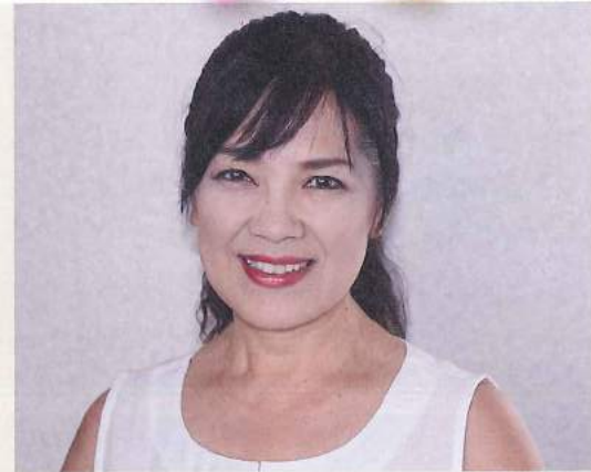
徳島県エアロビック連盟 理事長