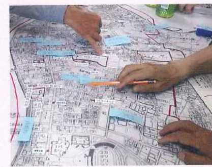
福祉資源のマップづくり