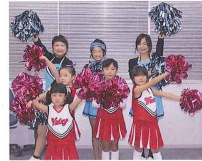
チアに興味のある方、メンバー募集中!

もともとは大人だけが集まってできたチームでしたが、今は小学3年生を中心に、子どもと大人10名くらいで活動しています。今は踊っていない会員もいろいろとサポートされています。立ち上げた当初は、「ダンス頑張るぞ!!」という気持ちでやっていましたが、今は本格的なダンスではなく、小さな子どもも踊れるようなダンスを楽しみながらやっています。徳島ヴォルティスやインディゴソックスなど、地域のプロスポーツの試合で応援をしたり、念願だった施設の慰問など、地域を元気にするお手伝いをしています。