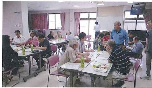
地域福祉活動計画策定委員会

阿南市社会福祉協議会では、阿南市地域福祉活動計画策定委員会及び14地区の策定委員会との協働により、平成29年度から33年度までの第2期阿南市地域福祉活動計画を策定しました。策定にあたっては、「このころのきづなつないでえがおのたのしいまちに」を基本理念に、自分たちのまちを見直し、良いところ、悪いところを考えてもらい、もっとこうなったら住み慣れた環境で住み続けられる、ここで住んでいきたい、というまちを描くことから始めました。社会情勢の変化と共に私たちの生活も変わりつつありますが、平成24年度に策定した第1期地域福祉活動計画における基本目標「交流」「環境」「健康」「安心」は、そのまま第2期にも用い、見守り活動や災害対応等、より具体的に継続性のある地域福祉活動を実践しています。 平成26年に加茂谷地区等に甚大な被害をもたらした水害では、社協が立ち上げた阿南市災害ボランティアセンターにおいて、運営の担い手不足が課題となりました。そこで「災害ボランティア養成研修」を開催し、