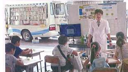
親子参加型環境学習