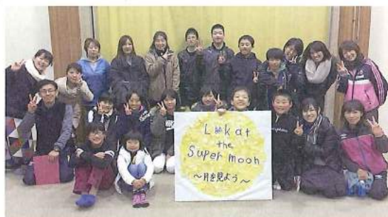
かみかつTICチャレプロ子ども社

地域の福祉関係団体との繋がりがあること、住民やボランティアによる地域力を活かした支援を続けていける強みがあることに気づかされます。今後も地域の方々を協力し、地域福祉に向き合うことを探っていきます。