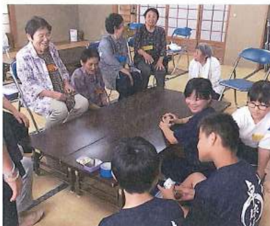
お年よりと冷たいものを作り隊