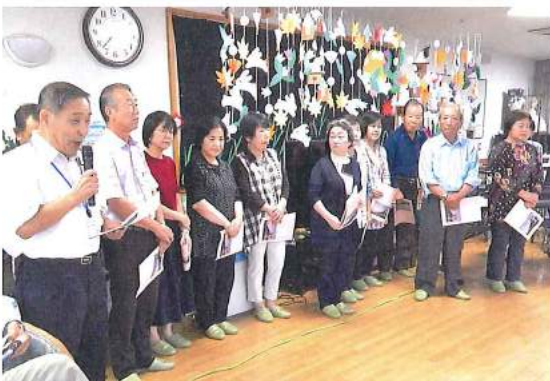
高齢者施設などへの交流訪問活動

上板町社会福祉協議会には、民生委員児童委員と密接な連携を保ちながら地域福祉の向上を図ることを目的とする「上板町福祉委員会」があり、この「上板町福祉委員会」の福祉委員は、3年間の任期で、町内27地区に1人ずつ配置され、ボランティアとして活動しています。また、福祉委員は、高齢者世帯等への訪問をはじめ、社会福祉施設への交流活動や地域行事への参加などの様々な福祉活動に取り組んでいます。