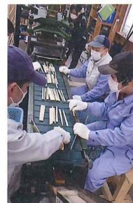
割り箸生産活動の様子

なってきたと感じています。現在、社会福祉法人には「地域における公益的な取り組みをはじめ5つの改革」が求められています。当法人においても、公益的な事業として「博愛まつり」「理事長杯争奪球技大会」「博愛ふれあいフェスティバル」と、地域住民や関係機関の協力のもと、施設利用者や地域住民が交流できるイベントを40年に渡り継続してまいりました。