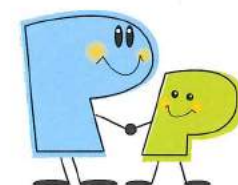
マスコットキャラクター プラザ

770-0873 徳島市東沖洲2丁目14番地 沖洲マリンターミナルビル1F tel: 088-664-8211 fax: 088-664-5345 e-mail: info@plaza-tokushima.com http://www.plaza-tokushima.com http://www.tokuvc.jp