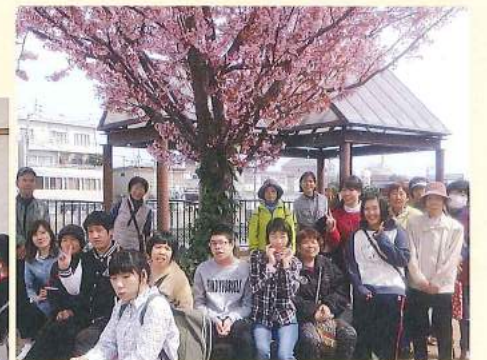
メンバーとボランティアで散歩に ～休日レスパイトハピフヘホ～