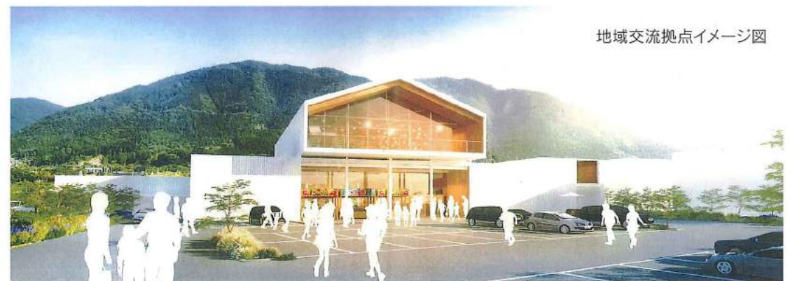
地域交流拠点イメージ図

さて、私自身が配属しているセルプ館は、障がい者の方と一緒に行う活動です。私自身は「利用者の方々の生活の質を向上させること」を目標に、真摯にニーズに添えていくことが一番の基本である。と指導いただいたこの言葉を忘れず、いつも楽しく元気に、これからも精進していきます。 (※注釈) 利用者工賃とは、「利用者」に、生産活動に係る事業の収入から生産活動に係る事業に必要な経費を控除した額に相当する金額のこと。