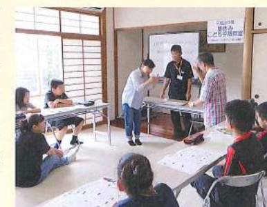
夏休み子ども手話教室

の高齢化が小松島市でも進み、若い世代の参画を進めることが課題になっています。そこで、小学生向けに夏休みに実施している手話講習会を春休みにも実施しようとボランティアと企画中。どのようになるか楽しみです。