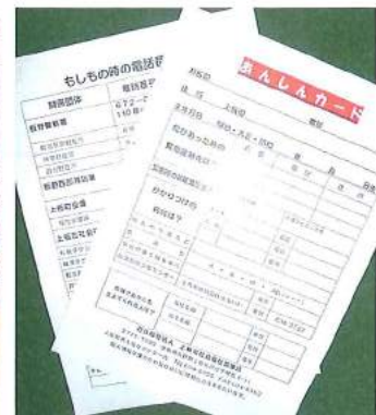
もしもの時の「あんしんカード」