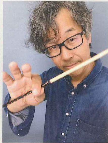
小川直樹写真事務所