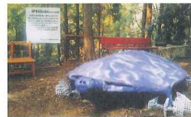
製作した日本最古のカメのオブジェ