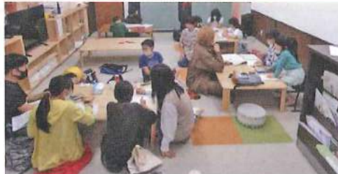
放課後に行われる 「しゅくだいカフェ」の様子