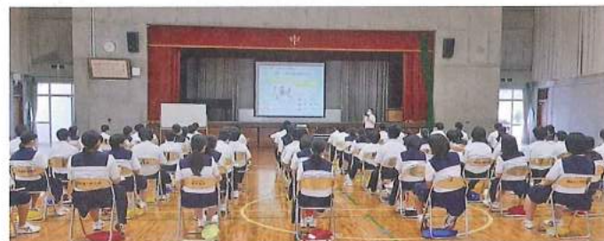
中学校へ出張授業

し、学生たちが徳島を知り、学び、徳島と繋がる活動をしていきたいと思っています。具体的には、徳島の企業・団体のPRをホームページ制作や動画制作、SNS発信などでサポートするチームを作りたいと思います。近年の学生は、社会になんらか貢献したいという願望がありながら、地域の企業や団体と繋がっていないため活動がボランティアにとどまっています。地域と学生を繋ぎ、地域に貢献できる経験を少しでも多く積んでもらえるチャレンジをサポートしていきたいと思っています。