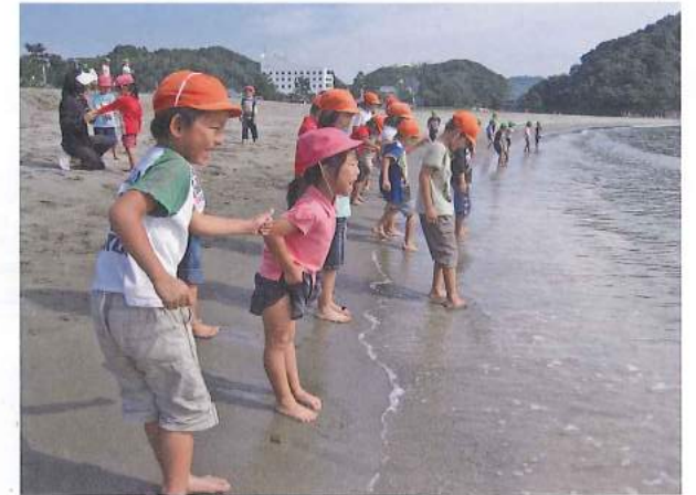
自然に触れる浜遊び

小学生になっても学校から帰ると、園児たちを引き連れて裏山に登ったり銀杏の木に登って遊んだり、まるで園児たちの番長のように、楽しいこと、危険なこと、ドキドキすることを教えて、よく祖母から叱られていました。