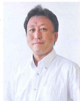
NPO法人 チャレンジサポーターズ理事長 創業アドバイザー (徳島県信用保証協会/ とくしま産業振興機構)