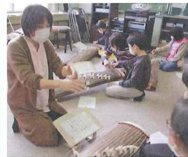
昭和小学校で行われたNPO出前授業