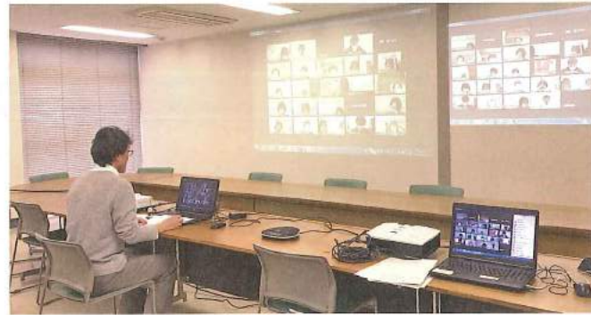
記録の書き方研修の様子（総合福祉センターにて）