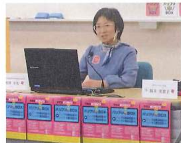
You TubeでパブリックBOXを配信している様子