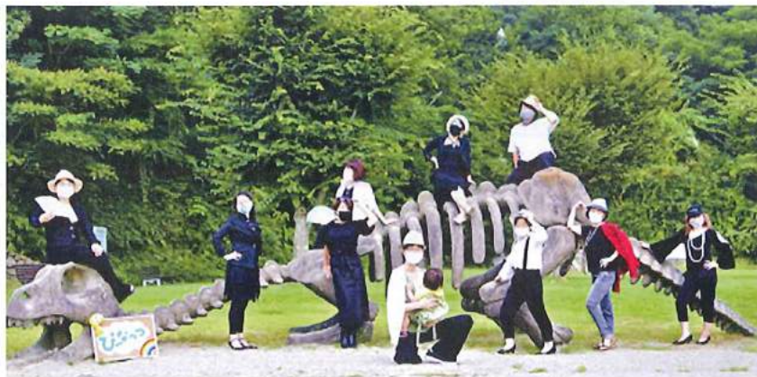
イタノザウルスと「ピーなっつ」のメンバー