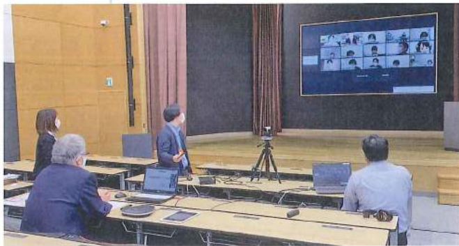
新任職員研修の様子（健祥会グループ本部にて）

講師の先生方も、今年度は形を変えての研修会となりましたが、多々ご協力をいただき大変お世話になりました。今後も引き続きどうぞよろしくお願いいたします。