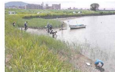
子どもたちによる吉野川干潟の調査の様子