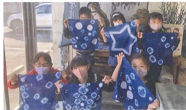
とくしまチャレンジ塾