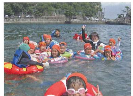
年2回楽しむ海水浴

現在では地域の主要産業であった漁業が衰退し、子どもも劇的に少なくなりました。漁師の子という特殊環境の幼児は少なくなり、今ではシングルマザーの子どものケアが大きな課題となっています。国の制度改革などありますが、福祉の原点は目の前にいる子どもの生活と成長を守っていくことであることを忘れず、子どもたちの実情から目を背けることなく、地域に根ざした福祉法人として保育園を運営し、地域から愛されたいと思っています。