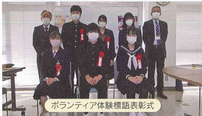
ボランティア体験標語表彰式