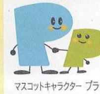
マスコットキャラクター プラザ