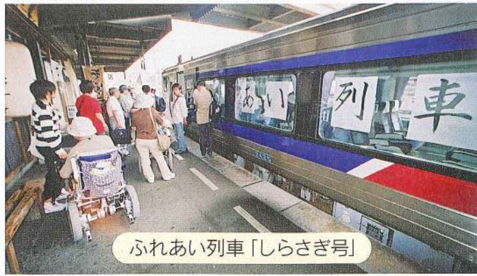
ふれあい列車「しらさぎ号」