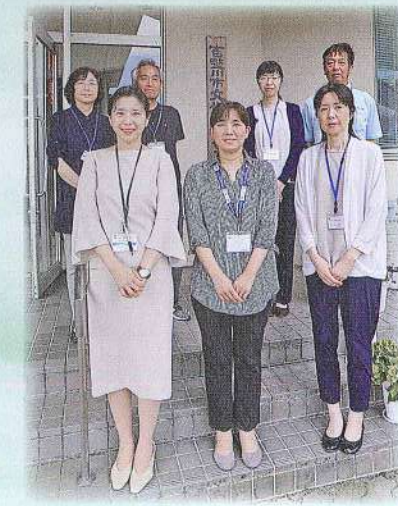
(文化協会・文化研修センター 職員一同)