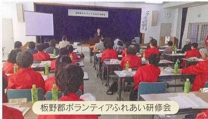
板野郡ボランティアふれあい研修会