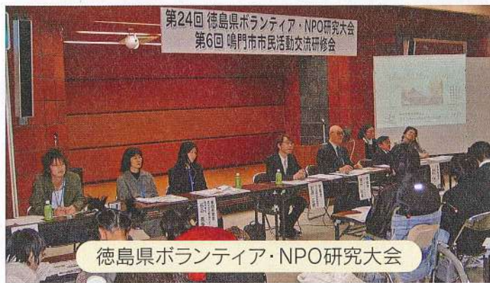
第24回 徳島県ボランティア・NPO研究大会 第6回 鳴門市市民活動交流研修会