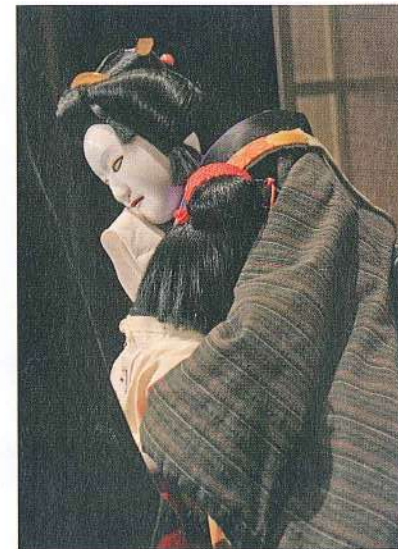
おつるを抱きしめるお弓

名所旧跡を巡る従前の観光から、その土地の風土や歴史を知り、日本人の暮らしや感性に触れることこそが、日本を訪れる外国人にとって最も感動するコンテンツになると考えている。日本人の感性が色濃く宿る芸能を通じて、国内外のさまざまな地域と、ひとつずつ丁寧に、一歩踏み込んだつながりをつくっていくことが、徳島の活性化に向けて私たちのできることだと考えている。