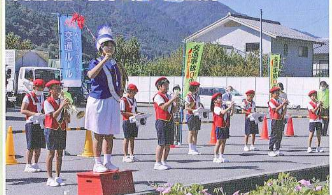
三好市池田地区民生委員児童委員協議会