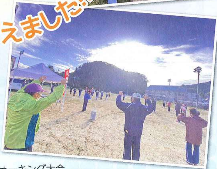
設立10周年記念ウォーキング大会