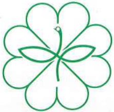
民生委員・ 児童委員のマーク

令和4年12月1日に 民生委員・児童委員の 一斉改選が行われ、 2022名(内、新任530 名)の方が新たに選任 されました。民生委 員・児童委員は、民生 委員法や児童福祉法に