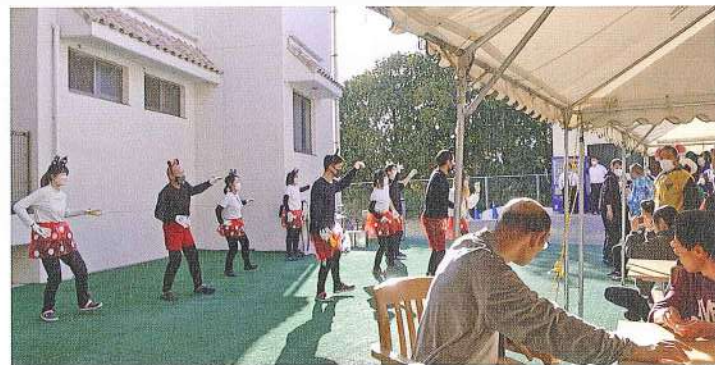
ハロウイーンイベント

と思い、障がい者福祉に関わる仕事をしたという気持ちで明確になりました。 ルキーナ・うだつで働き始めると、沢山の利用者さんに出会い、利用者さんの純粋さ、そして、利用者さん1人1人が沢山の生きづらさを抱えて生活していることを知りました。素直に物事を受け止めるその姿の中に、自分の気持ちや伝えられない、衝動が抑えられない、こだわり行動によって自身を苦しめてしまっている、沢山の困難を抱えて生活しているのだと。また、それらによって自傷や他害が起こってしまったり、こだわりの強化に繋がってしまっている、より生きづらさを抱えているようになってしまった方もいました。個々の障がい特性にあった支援をすべきではあるものの、働き始めて4年目の今でも、理解しきれない部分があると感じます。支援していく中で、利用者さんが楽しく過ごしていけるように