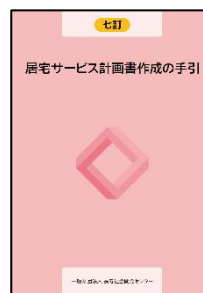
七訂/居宅サービス計画書作成の手引