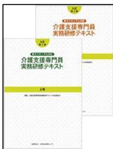
七訂第2版/介護支援専門員実務研修テキスト (全2冊セット)

※テキスト・手引きは副教材として購入いただく必要がございますが、別途お手元に御準備いただける場合は、別紙申込書のテキスト購入欄(不要)に○をつけてください。